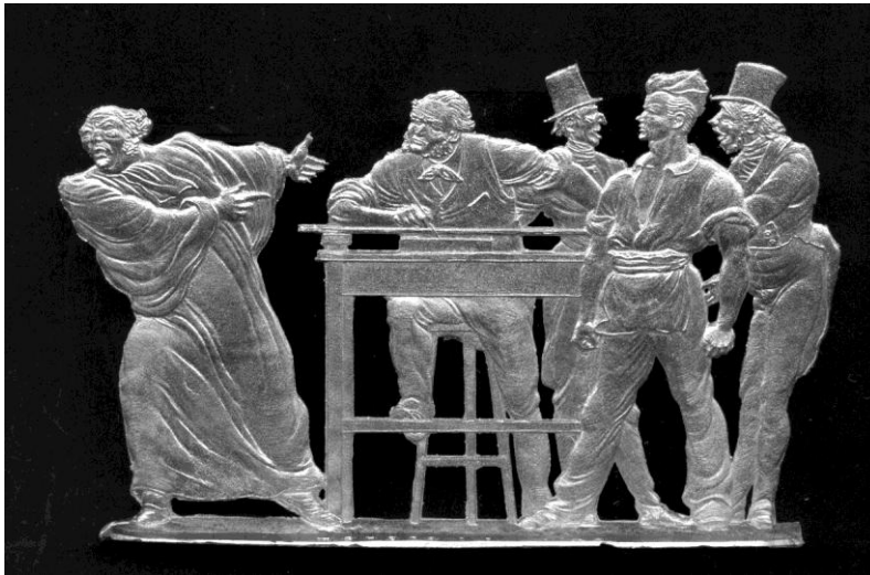
GA01: Honore Daumier – Liberte de la Presse (54mm)

Alleinvertrieb im Auftrag des Formeneigentümers